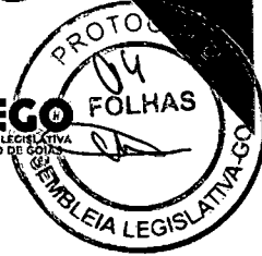
VETER MARTINS Deputado Estadual - PATRIOTA