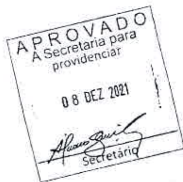
VIRMONDES CRUVINEL Deputado Estadual - Cidadania

SALA DAS SESSÕES DA ASSEMBLEIA LEGISLATIVA DO ESTADO DE GOIÁS, 8 de dezembro de 2021.